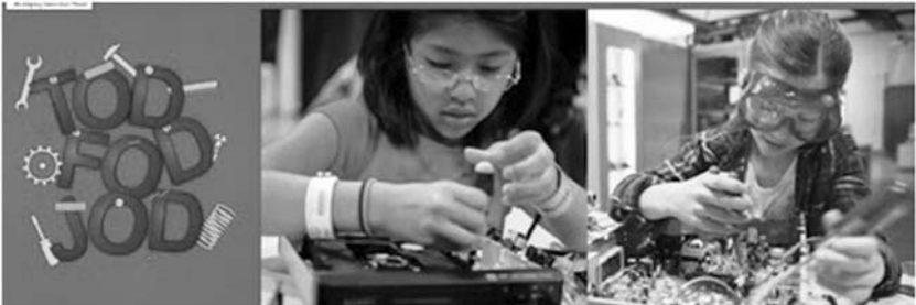
તોડ, ફોડ કે જોડના વર્ગમાં

આ નવીનતાઓ ઉપરાંત તેઓએ યુનિવર્સિટીમાં એક એવું ઉપકરણ વિકસાવ્યું