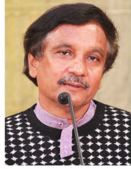
‘ગાંધી : આવતી કાલે’ વિશે સંજય-તુલા