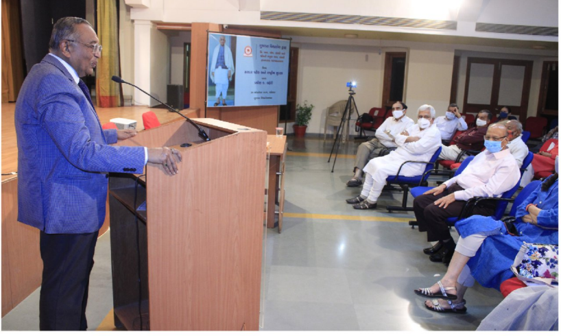
‘સરદાર પટેલ અને રાષ્ટ્રીય સુરક્ષા’ વિશે પ્રવીણ ક. લહેરી